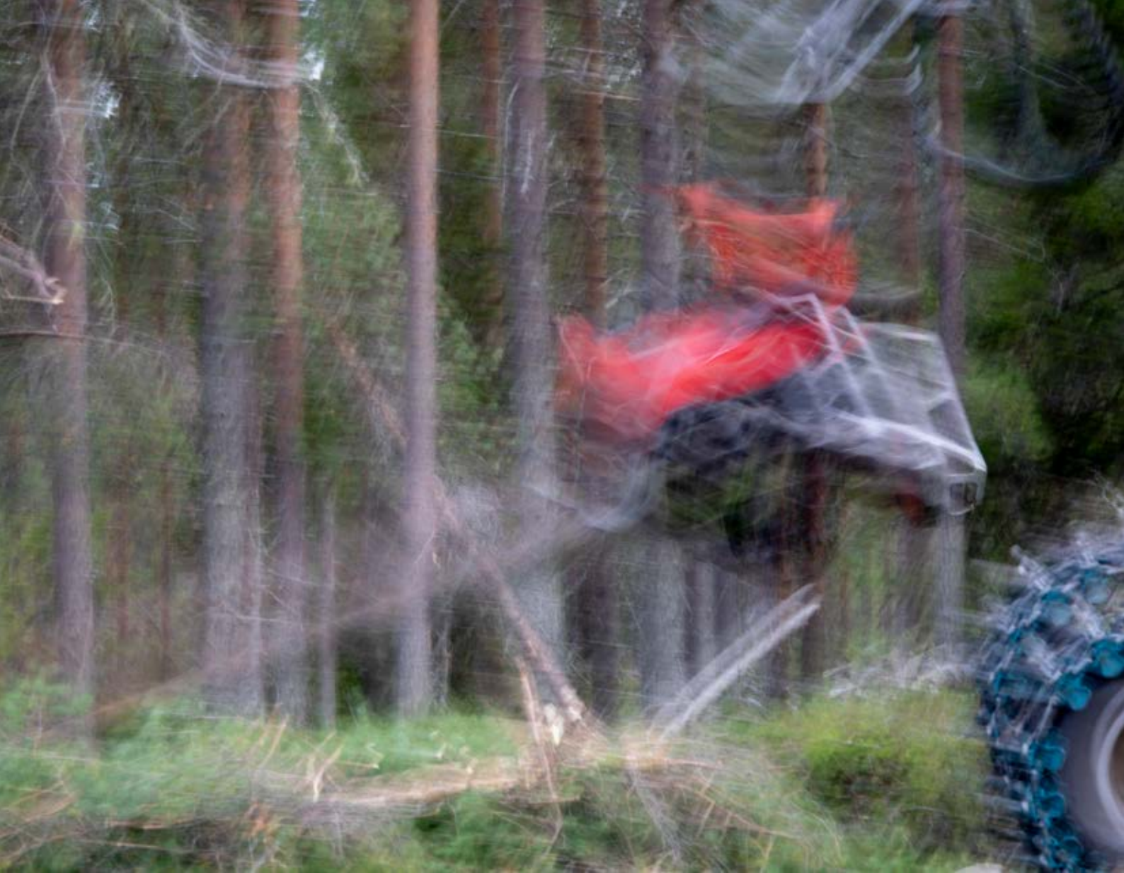
Kuva 1. Metsäsuhteita - teoskuva. Kuva: Kalle Immonen, 2018.