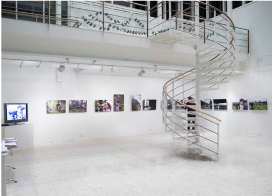
Kuva 3. Luontovalokuvanäyttely Kuusamo-talolla joulukuussa 2018.

rottiin projektin taustasta ja ideoitiin alustavasti, miten, missä ja milloin metsäsuhdetta kuvaavia luontokuvia voitaisiin ottaa. Projektiin valitaan projektiin osallistuvien tahoilta kerättävien esitysten perusteella paikallisesti mielenkiintoisia metsäkohteita.