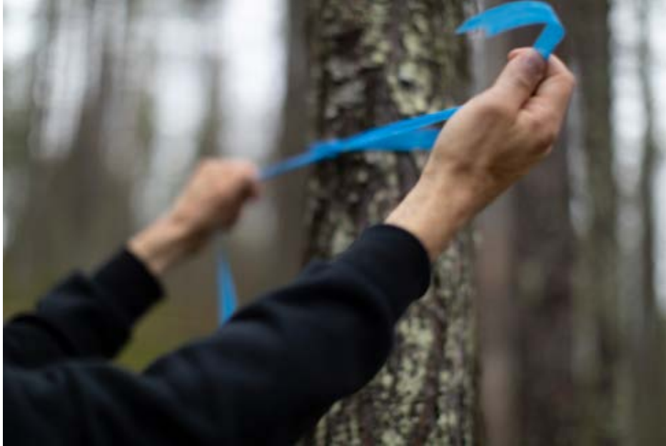
Kuva 4. Metsäsuhteita -teoskuva.

nessa. Tutkimuksessa tarkastellaan myös, millaisia valintoja kuvien tuottamisen prosessissa havaittiin ja miten nämä valinnat poikkesivat toisistaan eri tutkimushenkilöiden välillä. Tutkimuksessa tarkastellaan, miten kuvien tuottamisessa tehdyt valinnat näkyvät näyttelyyn valittujen metsäsuhdetta kuvaavissa luontokuvissa.