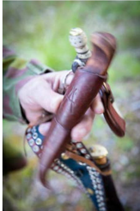
Kuva 2. Metsäsuhteita -teoskuva. Kuva: Kalle Immonen, 2018.

Projektiin liittyvät haastattelut ja kuvaukset toteutettiin Kuusamossa ja Taivalkoskella vuosien 2017 ja 2018 aikana. Tutkimushenkilöille tehtiin alkuhaastattelu, jossa ker-