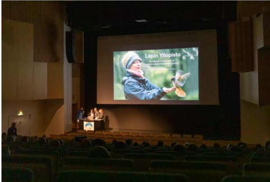
Kuva 5. Opiskelijat esiintymässä Kuusamo Nature Photo 2018 -tapahtumassa.

ten esittely paikallisille elinkeinoelämän edustajille Rukalla sai innostuneen vastaanoton niin osallistujissa kuin myös lehdistössä. Koillissanomat julkaisi siitä aukeaman kokoisen artikkelin. Myös Vuotungin yhteisötaidetyöpaja ja useat näyttelyt ovat saaneet runsaasti palstatilaa Koillissanomissa, Koillismaan Uutisissa ja Lapin Kansassa niin painetuissa lehdissä kuin niiden verkkoversioissakin. Kuusamon paikallislehdissä juttuja on ollut noin kaksikymmentä. Maisteriohjelmasta on kerrottu yleisemmin paikallislehtien lisäksi myös Lapin yliopiston Kide-lehdessä.