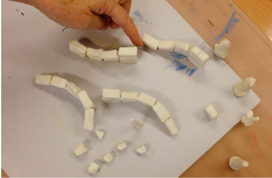
Kuva 1. Lumiveistosten suunnittelua.