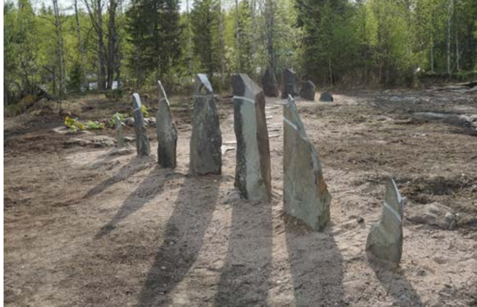
Kuva 2. Yhteisötaidetta Vuotungissa. Kuva: Salla-Mari Koistinen, 2018.

tuloksia. Syntynyt dialogi ryhmien ja henkilöiden välillä toimi tässäkin katalyyttinä erilaisten luontosuhteiden ja taiteen vaikutusten arvioimiselle.