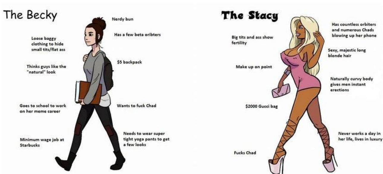
Kuva 2. Beckyn ja Stacyn eroavaisuudet. (Reddit, r/IncelTears)

Edellinen kirjoittaja näkee seksuaalisen markkina-arvon teorian selittävän inceiden tilanteen. Forumilla "leikitellään" ajatuksella, jonka mukaan pakkoavioliitot, etnisen erottelun ja perinteiset sukupuoliroolit toimisivat vastauksena inceiden kohtaanto-ongelmaan. Logiikan presuppositiona toimii ajatus, jonka mukaan (miesten) seksuaalinen aktiivisuus olisi tärkeämpää kuin saavutetut ihmisoikeudet esimerkiksi pakkoavioliiton tai vapaan liikkumisen ja parinvalinnan tai pariutumatta jättämisen suhteen. Kirjoittaja näkee inceliyden naisten saavuttamien oikeuksien sekä globalismin synnyttämänä ilmiönä. Katkeruus ei kohdistu paremman markkina-arvon omaaviin miehiin, joiden voitiin myös toisenlaisella logiikalla nähdä olevan inceiden kilpailijoita. Sen sijaan viha kohdistetaan naiseen, joiden seksuaalisuutta tai valinnanvapautta ei rajoiteta. Chadien ihailu ja toisaalta halveksunta naisten itsemääräämisoikeutta kohtaan noudattelee homososiaalisia käyttäytymismalleja, joissa miesten välinen nokittelu ja kilpailu purkautuu kilpailuasetelman ulkopuolella tai sen kohteena oleviin väkivaltana – joko verbaalisena tai fyysisenä (Jokinen 2000, 29 – 40). Naisvihan ja väkivallan ihailun voidaan näin nähdä olevan projektio häviöstä miesten välisessä kilpailuasetelmassa.