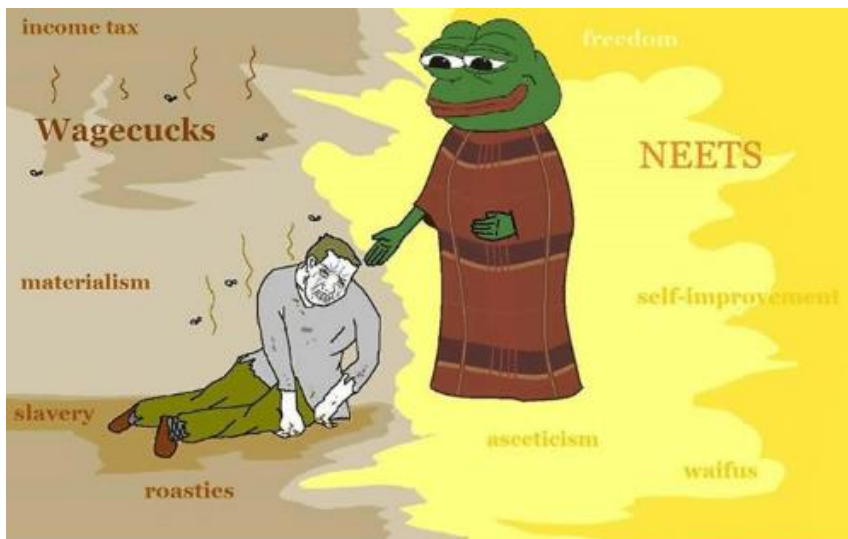
A NEET meme.

min aiheuttama ilmiö. 5 Tässä logiikassa miesten kollektiivinen motivaatio työskennellä tai koulutautua sidotaan ajatukseen heille kuuluvasta palkkiosta – vaimosta ja perheestä. Tämän logiikan mukaisesti incelit sitovat miehen arvon tämän kykyyn elättää perhe ja jatkaa sukuaan. Inceleiden syrjäytymisretoriikkaa värittävät ulkonäköpaineet, jotka saavat lisäpontta teknologian luomista mahdollisuuksista valita tapailtava kumppani ensisijaisesti ulkonäön perusteella.