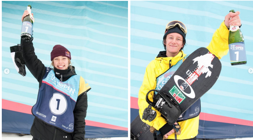
Kuva 12 Zoy Synnott | Kuva 13 Redmond Gerard

Thorpen tutkimuksessa kävi ilmi, että osa lumilautailulehtien toimituksessa työskentelevistä henkilöistä uskoivat naisten olevan lajissa heikompia kuin miehet ja siksi heitä näkyy vähemmän lumilautailulehdissä. Thorpen mukaan tämä kertoo siitä, että naisten tulee yltää miesten tasolle, jotta heidät otettaisiin mukaan lehtien sivuille (Thorpe 2008, 206). Aineistoni pohjalta tämä väite ei pidä paikkaansa Snowboarder Magazinen Instagram -tilillä, sillä selvästi tilin ylläpitäjät ovat kokeneet naisten tempuat tarpeeksi kiinnostaviksi ja vakuuttaviksi ottaakseen ne mukaan tilin julkaisuihin. Naisista ei ole vain sellaisia julkaisuja, joissa he olisivat rikkoneet jonkinlaisia ennätyksiä ja näin yltäneet miesten tasolle. Heidät on otettu osaksi normaalia lajikulttuuria.