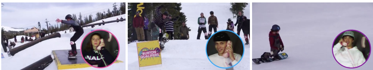
Kuvat 9-11 Burton Qualifiers -mainosvideo

Huomion arvoista on esimerkiksi se, kuinka yksi miespuolinen hahmo kommentoi erään naisen laskusuoritusta sanomalla “I wish I could do that”. Lausahdus on pieni yksityiskohta, mutta pidän sitä suurena merkinä siitä, ettei mainoksessa sukupuolella ole väliä. Thorpen (2008, 2010) teksteissä nousi ajoittain esille, että naisia pidetään lumilautailukulttuurissa lähtökohtaisesti huonompina kuin miehiä. Edellä mainittu lausahdus ei tunnu allekirjoittavan tällaista ajatusmaailmaa, sillä mies toteaa sukupuolestaan riippumatta, että toivoisi osaavansa laskea kuten videon nainen.