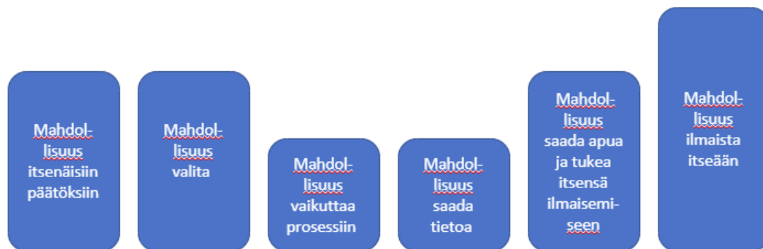
Kuvio 1. Osallisuuden ulottuvuudet (Thomas 2002, 176.)