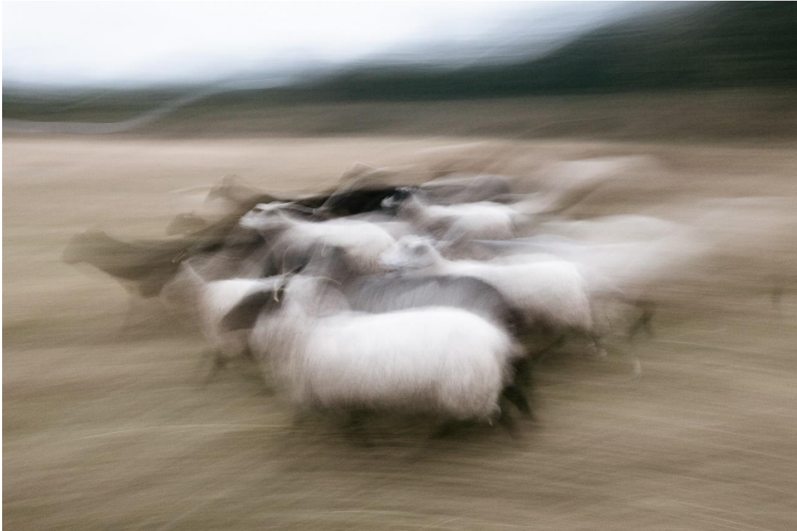
Kuva 2. Moneus , sarjasta Tasanko . (Siira 2019)

Deleuze ja Guattari (1992, 49) kehottavat pyrkimään kohti rihmastollista, uutta luovaa ajattelua, ja kirjoittavat: ”Älkää olko yksi tai monta, olkaa moneuksia! Tehkää viivoja, älkää pisteitä!” Kuvasta 2 voi nähdä, kuinka lauman rytmiin mukautuminen venytti pisteet viivoiksi ja teki kuvasta myös hieman maalauksen kaltaisen. Kokonaisvaltainen, toisten kehoja ja olemista mukaileva liike myös muistutti valokuvaamisen sijaan pikemminkin maalaamista, jonka ranskalaisfilosofi Maurice Merleau-Ponty kuvaa olevan kuin nähdyistä olioista kumpuavia ilmauksia, eleitä ja ääri viivoja. Luomisessa oliot ikään kuin siirtyvät maalariin itseensä, jolloin sen sijaan että maalari lävistäisi maailmankaikkeuden, maailmankaikkeus pikemminkin lävistää hänet. (Merleau-Ponty 2012a, 431–432.)