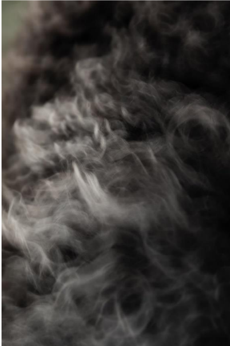
Kuva 3. Alttius , sarjasta Tasanko . (Siira 2019)

Kotieläinten ruumiillisuuteen liittyy tietty alttius haavoittuvuudelle, onhan heidän koko elämänsä – ravinto, suoja ja lopulta myös henki – ihmisen käsissä ja päätettävissä. Onkin mielenkiintoista, että vasta pysähtyminen teki tuon suojaantumisen tunnistamisesta todempaa. Edellisenä iltana koettu resonanssi oli siis jotain, jonka myötä haavoittuvuus ei vielä konkretisoitunut tavalla, jolla se tuli liki jaetussa lepo hetkessä. Kokonaisvaltaisemman empatian heräämiseen tarvittiin olento, joka makasi kädenmitan päässä, niin lähellä, että haavoittuvuutta pystyi koskettamaan (kuva 3). Havainto alleviivaa myös Derridan ajatusta siitä, kuinka juuri eläinten kyvyttömyys välttää kärsimystä voi koskettaa meitä enemmän