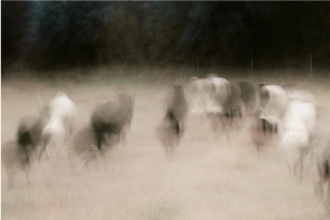
Kuva 6. Luopumisia , sarjasta Tasanko . (Siira 2019)

Ajatus asettumattomuudesta heijastuu myös Tasanko -sarjani teoskuviin, etenkin niistä viimeisimpään (kuva 6), joka paikallistuu vahvimmin jonnekin todellisuuden ja kuvitellun välille. Vaikka hahmojen muodot hajoavat, ne eivät tee sitä täysin. Kuva ikään kuin sallii todellisuuden tihkua lävitseen, tavoittaa siitä haalean heijastuksen, jonka sitten hajottaa lukuisiksi eri suuntiin karkaaviksi totuuksiksi. Ranskalainen filosofi Jean-François Lyotard kirjoittaa taiteen figuraalisesta ulottuvuudesta, joka on vapaa ”hyvistä muodoista” eli rationaalisuudesta, ymmärrettävyydestä ja ennakoitavuudesta. Figuraalisen kuvan tehtävä on avata eräänlainen todellisen maailman ja subjektiivisen mielikuvamaailman välillä keinuva välimailma, ja se tavoittelee sitä perspektiivin vääristymisillä, vääntyvillä muodoilla sekä muotojen epäjatkuvuuksilla. ”Huonot muodot” siis ikään kuin vapauttavat ”totuuden” näkyvästä maailmasta paljastaen ”totuuden” visuaalisen takaa löytyvistä eitietoisista voimista. (Snellman 2010.)