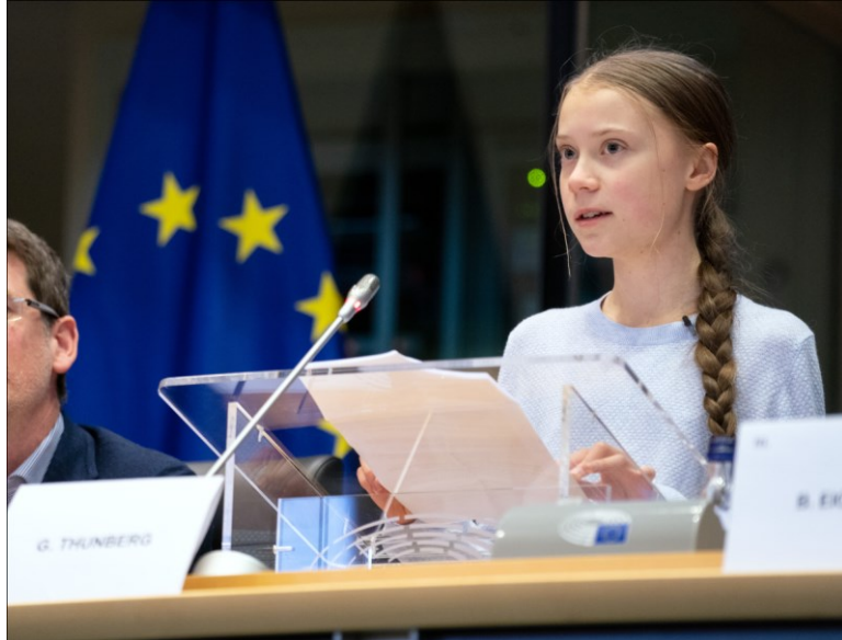
Kuva 3. Greta Thunberg puhumassa Euroopan parlamentin istunnossa maaliskuussa 2020. (Euroopan parlamentti, 2020)

2020). Vuodesta 2020 alkaen tapahtumat ovat olleet koronapandemiasta johtuen pienempiä, mutta ilmastolakkotoiminta on silti jatkunut kokoajan saaden yhä erilaisia muotoja ja tasoja.