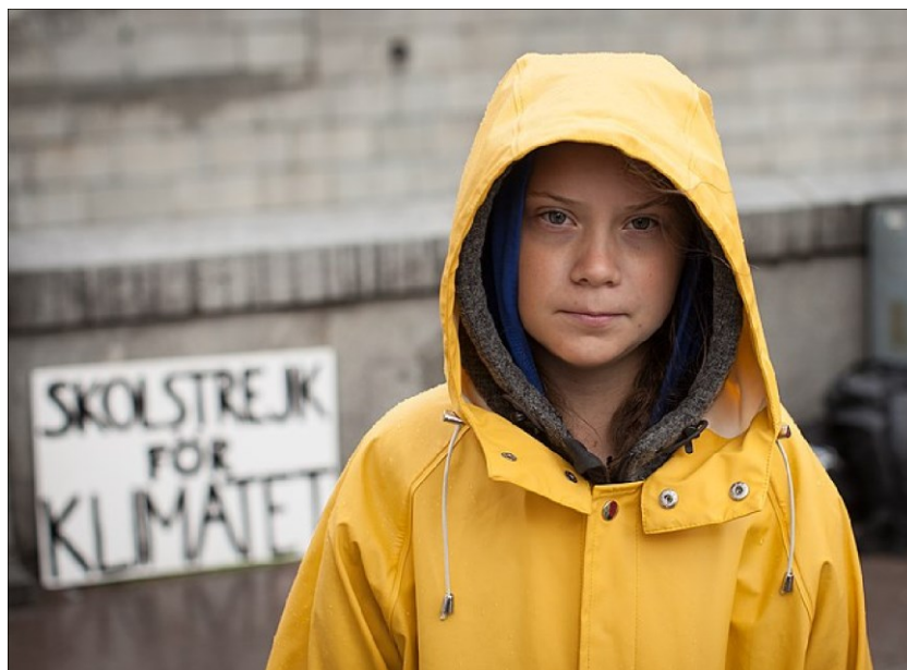
Kuva 2. Greta Thunberg Ruotsin parlamenttitalon edustalla elokuussa 2018.

Thunbergin toiminta Ruotsin parlamenttitalon edustalla sai nopeasti tukea muilta nuorilta. Kannatusta alkoi tulla tuhansilta nuorilta