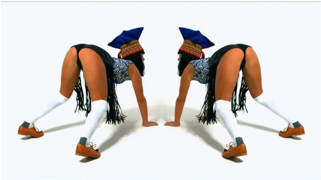
Kuva 18. Still-kuva Hiltusen Grind -videotyöstä.

Muotoilualoilla saamelaisväestölle aiheutti usein ärsynnystä epäaitojen saamenpukujen hyödyntäminen suomalaisen kulttuurin markkinoinnissa ja taiteessa. Kappaleessa 4.2 esitetyn Lumi Accessoriesin tapauksen lisäksi samankaltaisia esimerkkejä löytyi useita. Näitä olivat muun muassa valtion rahoittama Visit Finlandin 100 days of polar night magic -matkailumainos likaisine, villeine saamelaisineen sekä Jenni Hiltusen Grind -teoksessa esitetyt takapuoliaan hytkyttäneet feikkitaakkeihin pukeutuneet naiset (kuva 18.). 262