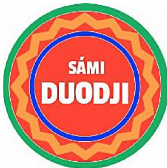
Kuva 13. Sámi duodji -merkki.

saamelaisesta alkuperästä, käsityöntekijälle se on laadun ja perinteen velvoite. Merkkiä on mahdollista käyttää perinteisten käsitöiden sekä perinteisen tavan mukaan kehiteltujen ja perinteisistä materiaaleista valmistettujen uusien tuotteiden yhteydessä. Matkamuistoiksi suunniteltuja esineitä vailla perinteistä käyttötarkoitusta ei merkitä saamelaisen käsityön merkillä. 87 Käsityömerkin juridisena haltijana toimii yhteispohjoismainen Saamelaiseuvosto, joka on valtuuttanut kansalliset järjestöt myöntämään merkkiä sääntöjen puitteissa jäsenilleen. Suomessa tunnusta hallinnoi Sámi Duodji ry. Pyrkimyksenä yhdistyksellä on ollut etenkin syntynsä alkuvaiheessa valvoa käsityön korkean laadun säilyttämistä. On ollut hyvä ensin nostaa perinteen tasoa ennen uuden kehittämistä. Näin saamelaiselle tekemiselle on syntynyt laatuajattelu. Tuotemerkki oli luontevaa jatkoa yli valtiorajojen tapahtuneelle yhteistyölle, joka oli tuottanut muun muassa yhteissaamelaisia käsityönäyttelyitä ja käsityökouluttamisen kehittämissalavereita. Sámi duodji -merkki kattaa nimenomaisesti perinteisen käsityön alueen, tuotekehittely tai uudet sovellukset puolestaan eivät kuulu sen piiriin. 88