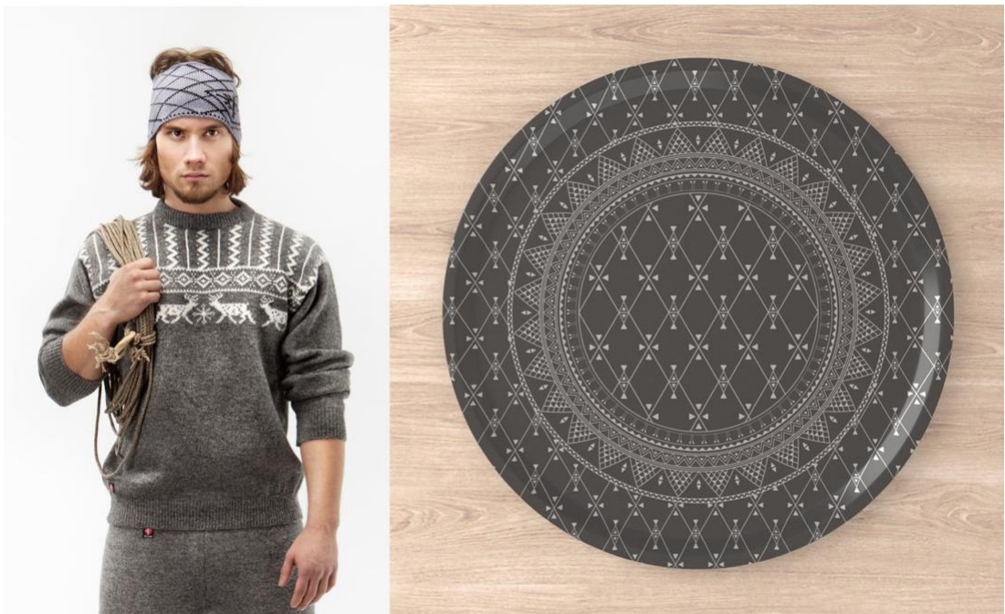
Kuvat 2. ja 3. Vasemmalla Graveniidin neulosvaatteita, oikealla Stoorstålkan tarjotin. Kuvaajat tuntemattomat. Kuvat: Graveniid 2021; Stoorstålka 2020.

Nykypäivänä saamelaisen käsityön rinnalle on kehittynyt uutta tekemistä, mikä ei enää sovi duodjille asetettuihin raameihin. Ruotsissa toimivan Stoorstålkan 9 ja Norjasta lähtöisin olevan Graveniidin 10 tuotteet (kuvat 2. ja 3.) ovat esimerkkejä teollisesti toteutetusta, saamelaiseen kulttuuriin pohjaavasta tuotemuotoilusta. Muotoiluilmiotä on saamelaisyhteisössä havaittavissa, vaikkei siitä ei juuri löydy tutkittua tietoa.