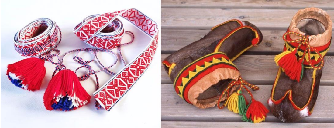
Kuvat 16. ja 17. Vasemmalla paulat, oikealla purkanahasta valmistetut naisen juhlakengät.