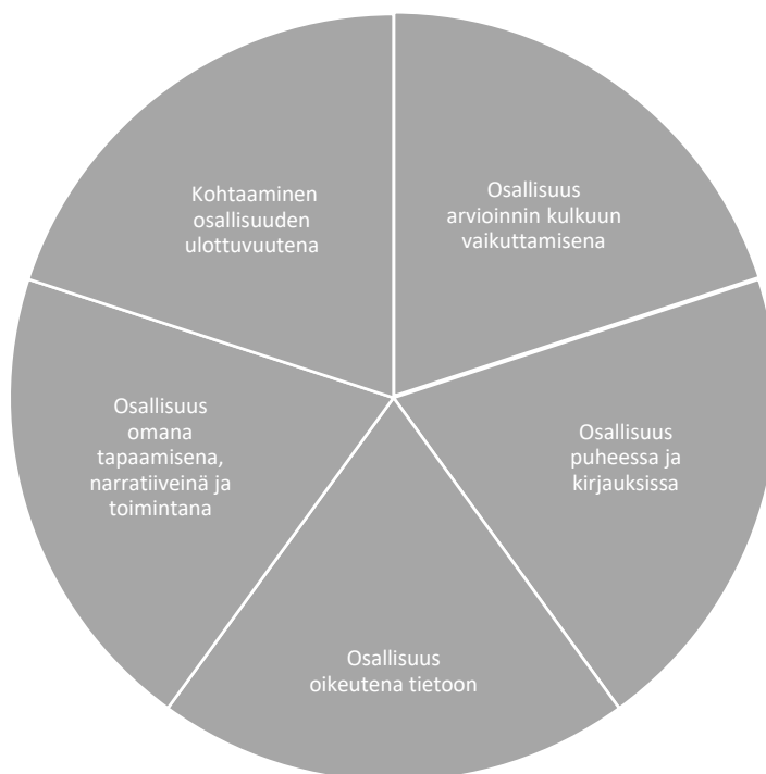
Kuvio 3 Tutkimuksen tuottama kuva lapsen osallisuuden rakentumisesta osallisuuden moninaisuuden kautta

tiivisena toimintana. Seuraavassa luvussa erittelen näitä neljää muotoa sosiaalityöntekijöiden tuottamien kuvauksiin ja merkityksiin perustuen, jolloin myös esittelen muodostamani kategoriat ja tutkimuksen tulokset. Lisäksi tuon esille sosiaalityöntekijöiden käsitteitä lapsen osallisuutta mahdollistavista sekä haastavista tekijöistä. Peilaan tuloksia myös aiempaan aiheesta tuotettuun tietoon ja tutkimukseen. Tutkimuksen ydintehtävä on ollut tuoda esille sosiaalityöntekijöiden näkemyksiä, minkä vuoksi olen käyttänyt myös suoria aineistolainauksia vahvistamaan sosiaalityöntekijöiden ääntä tutkimuksessa.