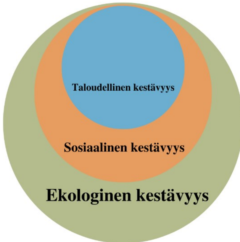
Kuva 2: Kestävän kehityksen osa-alueet ekologinen kestävyys keskiössä. (Pukkala 2021.)

Kolme kestävyiden osa-alueita sijoitetaan joidenkin määritelmien mukaan eriarvoisiksi kokonaisuuksiksi. Se riippuu myös tilanteesta, minkälaisista aiheista kuvataan. Yksi määritelmä korostaa ekologisen kestävyiden tärkeyttä muiden osa-alueiden rinnalla. Tätä määritelmää on käytetty muun muassa, kun puhutaan metsätalouden kokonaiskestävyydestä. (Pukkala 2021.)