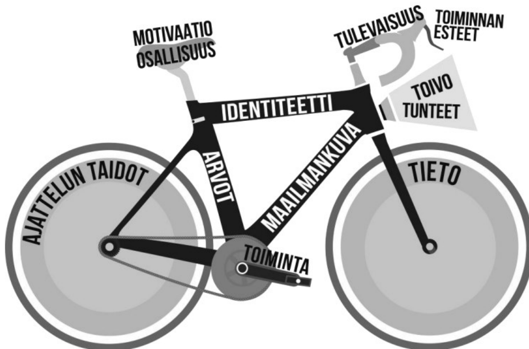
Kuva 3: Kokonaisvaltaisen ilmastokasvatuksen polkupyörämalli (Tolppanen jne. 2017, 7.)

Kestävyyskasvatukseen, niin kuin moneen muuhun kasvatukseen aiheeseen on luotu erilaisia malleja avuksi hahmottamaan kasvatusaiheen erityispiirteitä. Ympäristö- ja kestävyyskasvatusta kuvaamaan on luotu Ympäristökasvatuksen polkupyörämalli, jossa korostuu toimijuuteen kasvattaminen.