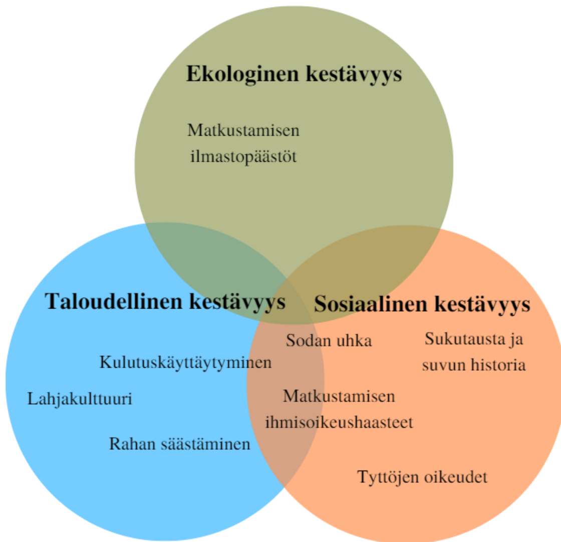
Kuva 5: Huoltajien ja lasten keskustelut kestävyiden eri osa-alueilla.