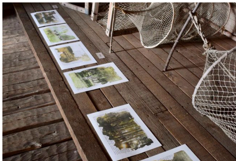
Mari Parpala Neljä lehmää on poissa , 2020. Kuvasiirto asetonilla ja käsinkirjoitus.