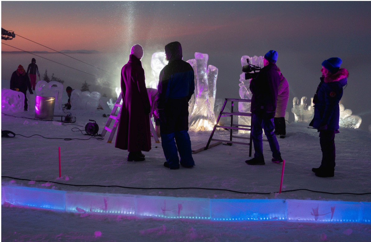
Kuva 1. Auroran pääpuhujana, Viron entinen presidentti Kersti Kaljulaid, tutustumassa ulkolavaan.

mastoaktivismiin, ilmastoviestintään kuin esteettisiin talviympäristöihin jään, lumen, valon ja liikkuvan kuvan keinoin (kuva 1). Taiteilijoiden intentiot ja tapahtumaorganisaatioiden tarpeet kietoutuivat toisiinsa, ja syntyi malli taiteilijan työstä lappilaisessa talvikauden tapahtumassa.