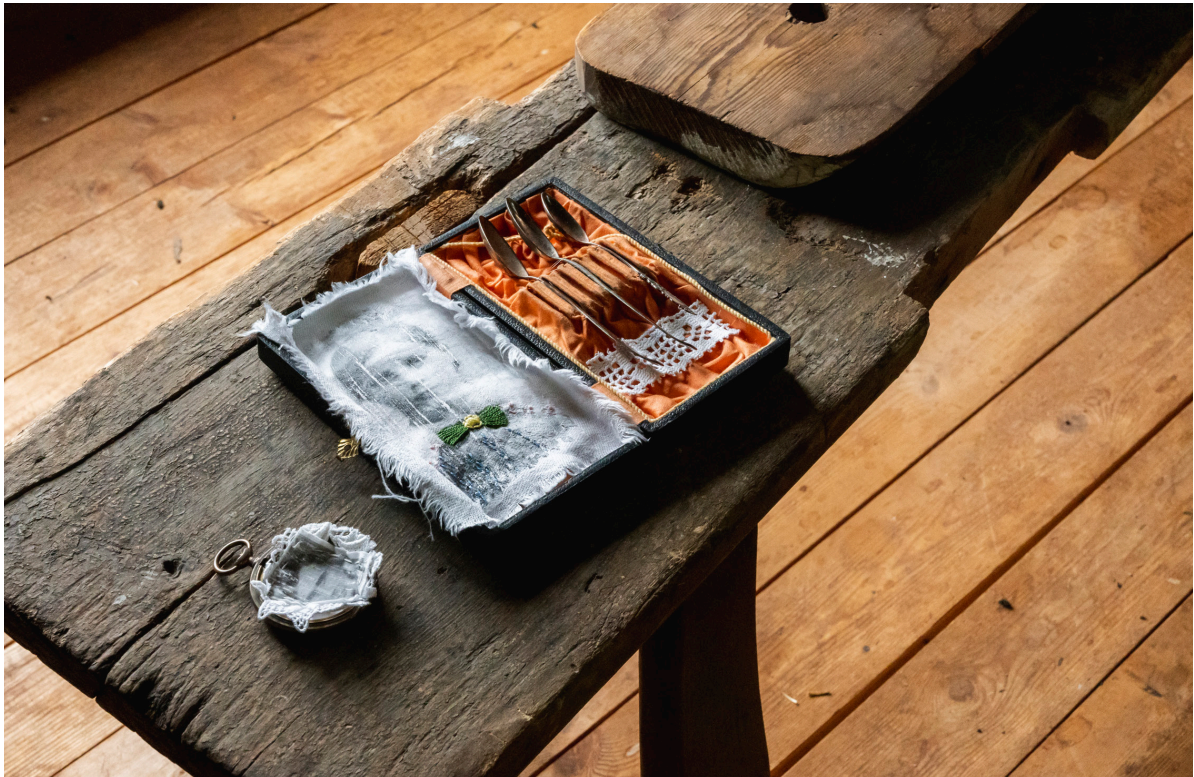
Kuva 2. Ritva Jääskeläisen Isoisän taskukello , 2019 (vas.) ja Perintö , 2020 (oik.).

"Upea esitys tai puhutteleva taideteos voi nostaa tapahtuman arjen yläpuolelle ja tuottaa suotuisan ilmapiirin liike-elämän tai politiikan neuvotteluille."