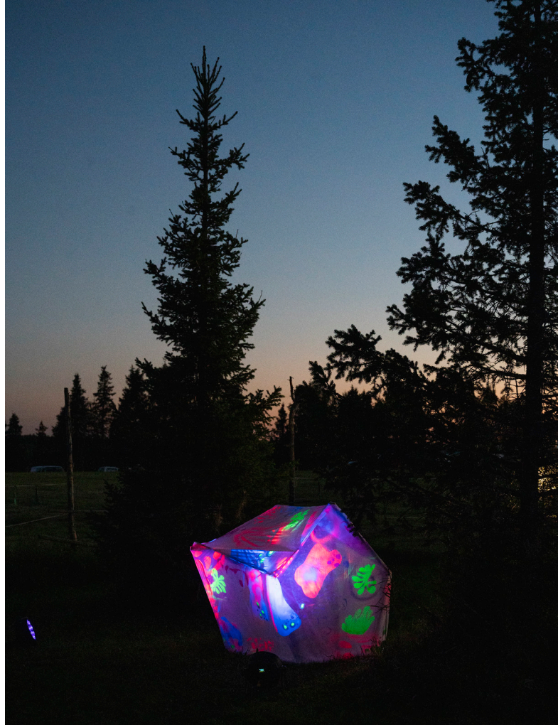
Tanja Koistisen Yksi kolmesta sammaleen kodista , 2022.

Edellisellä sivulla: Miia Mäkisen Shelter , 2022.