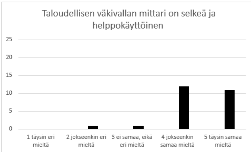
Kuvio 6: Taloudellisen väkivallan kartoitusmittarin helpokäyttöisyys

“Mittariston kysymykset ovat aseteltu selkeästi ja yksiselitteisesti niin, että sen käyttäminen on helppoa ja ymmärrettävää. Eri ilmenemismuodot on esitetty kuvaavasti ja niin, ettei väärinkäsityksiä tulisi. Arviointi helpottaa toimenpiteisiin ryhtymistä ja ohjaa oikein tuen piiriin. Viimeinen osio todella hieno lisä mittaristoon, selkeyttää ja helpottaa ammattilaista. Tilaa myös omille havainnoille, tieto pysyy ”tallessa”. ”