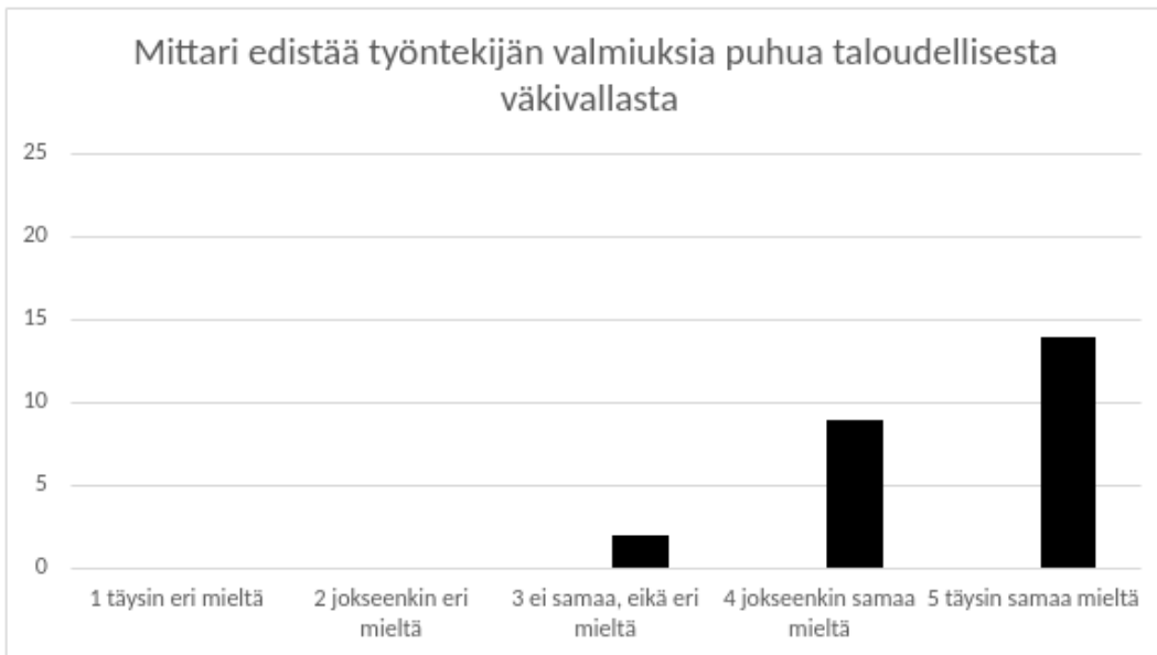
Kuvio 5: Taloudellisesta väkivallasta puhuminen

Kysyimme kyselyssämme myös sitä, että edistäkö kartoitusmittari työntekijän valmiuksia taloudellisesta väkivallasta puhumiseen. Vastausten perusteella kartoitusmittarin koettiin edistävän työntekijän valmiuksia asiasta puhumisessa. Vastauksissa nousee esille, että kartoitusmittari koettiin monipuolisena, tietoa lisäävänä ja ilmiötä eri näkökulmista avaavana. Ilman kartoitusmittarin tukea ilmiön tarkasteleminen ja tunnistaminen voisi olla huomattavasti kapea-alaisempaa. Aiemmissä tutkimuksissa onkin havaittu, että väkivallan kokemuksista valtaosa jää havaitsematta ilman systemaattisia ja strukturoituja kyselyjä. (Notko ym. 2011, 1604; Virkki ym. 2011, 280.) Erilaiset mittarit ovat toimivia työkaluja vakavia, hyvinvointia uhkaavia sosiaalisia ongelmia tunnistettaessa (Linnakangas ym. 2015, 412).