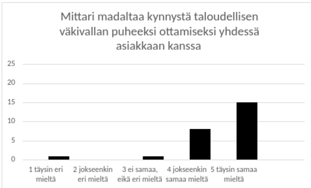
Kuvio 4: Taloudellisen väkivallan puheeksi ottaminen asiakkaan kanssa

Kyselyssämme tuli esille, että suurin osa vastaajista koki olevansa täysin samaa mieltä (n= 15) tai jokseenkin samaa mieltä (n= 8) siitä, että kartoitusmittari madaltaa kynnystä taloudellisen väkivallan puheeksi ottamiseksi yhdessä asiakkaan kanssa. Rahaan ja rahankäyttöön liittyvät asiat ovat yhteiskunnassa edelleen tabu ja niiden puheeksi ottaminen voi olla ammattihenkilöillekin vaikeaa aiheen sensitiivisyyden ja yksityisen luonteen vuoksi. Konkreettisen apuvälineen käytön koettiin tukevan haastavan ilmiön puheeksi ottamista.