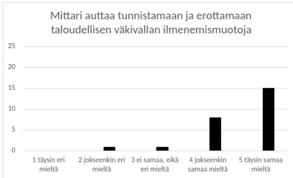
Kuvio 7: Taloudellisen väkivallan ilmenemismuotojen tunnistaminen.

Suurin osa kyselyyn vastanneista (n=25) koki olevansa täysin samaa mieltä (n= 15) tai jokseenkin samaa mieltä (n=8) siitä, että kartoitusmittari tukee taloudellisen väkivallan eri ilmenemismuotojen tunnistamisessa. Taloudellisen väkivallan kartoitusmittarissa väkivallan ilmenemismuodot on eroteltu Kaittilan & Nyqvistin (2014) nelijaottelun mukaisesti rahan liittyvään kontrollointiin, taloudelliseen hyväksikäyttöön, työssäkäynnin rajoittamiseen ja häiriköintiin sekä eron jälkeiseen taloudelliseen väkivaltaan. Kysyimme kyselyssämme myös yksityiskohtaisemmin sitä, miten neljä eri taloudellisen väkivallan muotoa tulivat tunnistettavaksi kartoitusmittarin avulla. Vastauksista ilmeni, että kartoitusmittarin koettiin tukevan erityisesti rahan käyttöön liittyvän kontrollonin (ka 4,6), taloudellisen hyväksikäytön (ka 4,5) ja eron jälkeisen taloudellisen väkivallan tunnistamista (ka 4,4). Heikoiten kartoitusmittarin tukeva työssäkäynnin rajoittamisen ja häiriköinnin tunnistamista (ka 4,1), jota saattaa selittää se, että kysymyksiä tästä taloudellisen väkivallan muodosta on kartoitusmittarissa vain kaksi. Vastauksissa ei noussut esille, että kartoitusmittarilla olisi erityisen haastavaa tunnistaa jotain tiettyä taloudellisen väkivallan ilmenemismuotoa. Kaiken kaikkiaan kartoitusmittarin koettiin tukevan hyvin taloudellisen väkivallan eri ilmenemismuotojen tunnistamista.