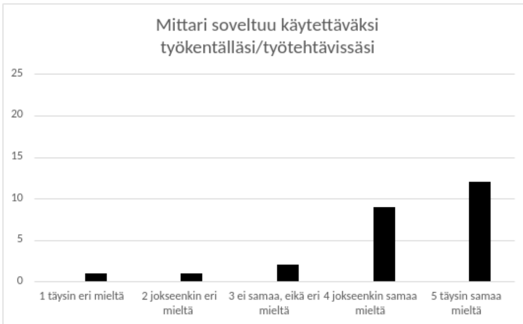
Kuvio 2: Mittarin soveltuvuus omalle työkentälle tai työtehtäviin

Pääosin vastaajat kokivat, että he voivat hyödyntää kartoitusmittaria omalla työkentällä jollakin tavalla. Vastauksia kuviossa 2 esitettyyn kysymykseen tuli kaikilta vastaajilta (n=25) ja heistä suuri osa (n=12) vastasi kartoitusmittarin soveltuvan heidän työkentälleen täysin. Lisäksi jokseenkin soveltuvaksi kartoitusmittarin koki 9 vastaajaa. Hyödyntäminen koettiin mahdolliseksi etenkin luottamuksellisissa asiakassuhteissa. Sosiaalityön ydin koostuu vuorovaikutuksesta asiakkaan kanssa, luottamuksellisesta dialogista, mikä pitää sisällään molemmien puolista kunnioitusta. Lisäksi tavoitteellinen työskentely vaatii tutkimuksellista teoretietoa, mutta myös kykyä ja välineitä tunnistaa hyvinvointia haastavia elementtejä. (Linnakangas ym. 2015, 406.)