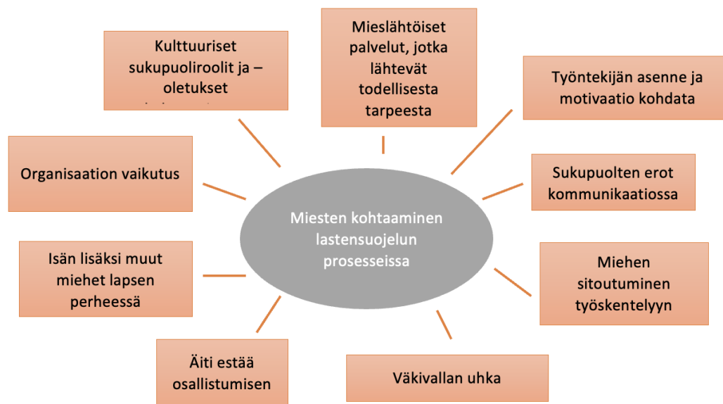
Kuvio 3. Miesten kohtaamiseen vaikuttavat tekijät.