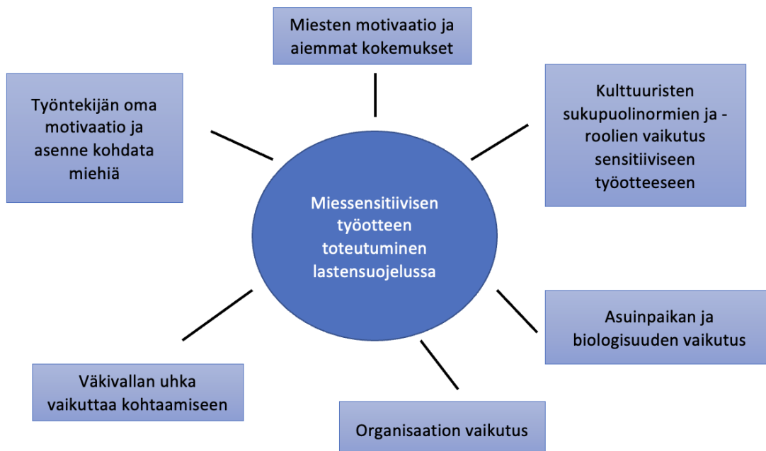
Kuvio 2. Miessensitiivisen työtteen toteutuminen ja siihen vaikuttavat tekijät.

aiemmat kokemukset, asuinpaikka ja biologisuus, työntekijöiden asenne ja motivaatio, organisaation vaikutus sekä työskentely väkivaltaisten miesten kanssa. Jatkossa tarkastelen tarkemmin näitä teemoja ja sisältöjä.