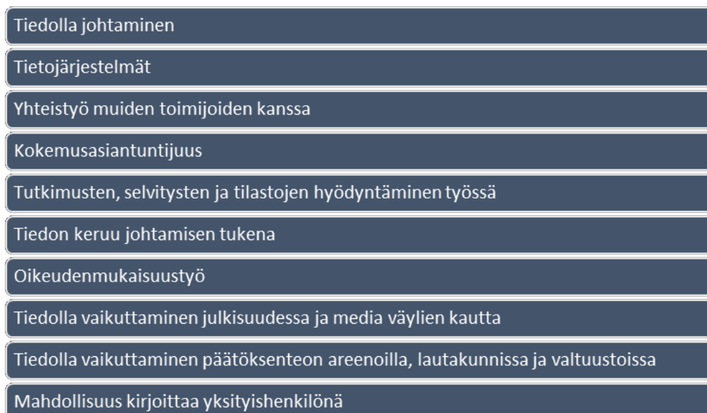
Kuvio 3. Analyysin tuloksena muodostetut 10 teemaa

Aloitin oman analyysiprosessini käymällä huolellisesti läpi litteroidun aineiston. Koska kyseessä oli minulle ennalta tuntematon aineisto, niin keskeistä oli aluksi tutustua kerättyyn aineistoon. Litteroitua aineistoa oli yhteensä 122 sivua, josta pyrin kokoamaan tietoja tutkittavien kohderyhmästä ja heidän työtehtävistään. Analyysin seuraavassa vaiheessa pyrin rajaamaan aineistoa oman tutkimukseni kannalta olennaisiin aiheisiin, jonka tukena käytin teemoittelua. Teemoittelussa ei niinkään olla kiinnostuneita siitä, kuinka usein tietty vastaus esiintyy. Pyrkimyksenä on sen sijaan pilkkoa ja ryhmitellä aineistoa sen mukaan, mitä kustakin aihepiiristä on sanottu. (Tuomi & Sarajärvi 2018.) Pyrin siis löytämään aineistosta yhtenäisiä teemoja tutkittaville esitettyjen kysymysten mukaisesti. Samanaikaisesti rajasin aineistosta pois sellaisia aihealueita, jotka eivät olleet oleellisia tämän tutkimuksen toteuttamisen kannalta. Nämä teemat liittyivät muun muassa sosiaalityön organisointiin sekä laajemmin sosiaalisen raportoinnin toteuttamiseen, mikä oli yksi alkuperäisen tutkimuksen keskeisistä teemoista. Lisäksi aineistossa käsiteltiin muutosta hyvinvointialueelle. Tätä aihealuetta olen tuonut esiin pohdintaluvussa muun muassa jatkotutkimusten näkökulmasta. Pyrin jaottelemaan teemoja mahdollisimman yksityiskohtaisesti, jonka jälkeen niitä muodostui yhteensä 10 (kts. kuvio 3.). Teemojen alle liitin ilmaisia tutkittavien näkemyksistä kyseiseen aiheeseen liittyen.