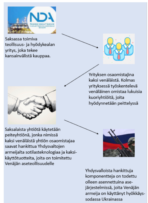
Kuva 1. Tapauksen Modus Operandi.

Syytteiden mukaan liikemies A:n ja liikemies B:n epäillään käyttäneen hyödykseen monimutkaisia yritysjärjestelyjä, pöytälaatikkoyhtiöitä, käteiskauppaa, kryptovaluuttaa ja kansainvälisiä pankkitilejä myös rahanpesussa, jossa on häivytetty rikollisella toiminnalla hankittua omaisuutta. Heidän epäillään peittäneen laittomasti hankittuja varoja ja häivyttämään niiden alkuperää hyödyntämällä tilitoimistoja, erilaisia maksutapoja ja veroparatiiseja. (Ibid.)