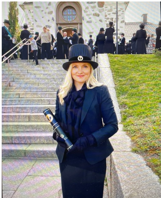
Kuva 3: Maria Ohisalo yhteiskuntatieteiden tohtorin tutkinto kädessään.

Maria Ohisalosta muodostui tasa-arvon puolella oleva, hiljainen mutta sisukas naisjohtajuuskuva, joka arvostaa rauhaa, yksilöllisyyttä ja paremman tulevaisuuden luomista. Ohisalo on kasvanut yhdessä yksinhuoltajaäitinsä kanssa, eikä hänen vanhemmillaan ole akateemista taustaa. Ohisalo itse on kuitenkin yhteiskuntatieteiden tohtori.