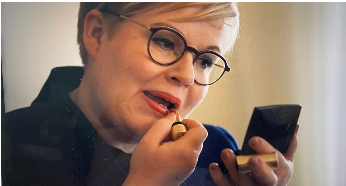
Kuva 5: Annika Saarikko lisäämässä huulipunaa.

Huulipunan lisääminen, eli meikkaaminen, on yleisesti hyvinkin feminiiniseksi mielletty käytäntö. Se, että Saarikko kertoo sen olevan yksi keino kohentaa itsetuntoaan, vakuuttaa hänen olevan tyytyväinen itseensä ja naiseuteensa. Hän kertoo myös tekevänsä aktiivista työtä mielensä kanssa, jotta politiikka ja maailman uutiset eivät haavoita häntä pysyvästi. Saarikko korostaakin, että poliitikolla pitää olla panssari ja tietyt rajat, joita noudattaa. Hän itse on muun muassa suojellut ja säästänyt itseään Ukrainan sotaan liittyvien uutisten seuraamiselta, jotta hän pysyisi työkykyisenä. Hän on myös antanut itsellensä luvan olla ymmärtämättä sotaa, jota hän luonnehtii mielipuoliseksi. Saarikon mukaan mielipuolisia asioita ei tarvitsekaan ymmärtää. Saarikon asenne ja tieto omista rajoistaan luo voimakkaan naisjohtajan mielikuvaa. Se, kuinka suoraan ja avoimesti hän puhuu oman työkykynsä ylläpitämisestä ja epävarmuuksiensa kohtaamisesta, saa katsojassa aikaan ihailua ja sympatiaa.