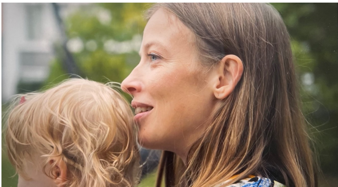
Kuva 8: Li Andersson picnicillä lapsi sylissään.

Andersonin herkkyyks ja lapsiläheisyys välittyy myös siitä, millaisissa paikoissa Anderssonia kuvataan. Dokumentissa on pätkiä, joissa Andersson pitää opetusvideoita lapsille, vierailee kouluissa ja vastailee lasten kysymyksiin. Dokumentissa on myös kohtaus Anderssonista pitämässä picnicia läheisten ystäviensä ja perheensä kanssa, josta on myös kuva alla.