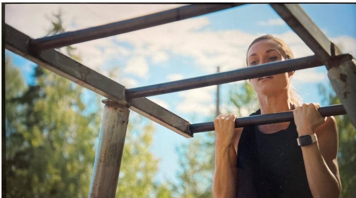
Kuva 2: Sanna Marin urheilemassa.

Voimaisen naisjohtajuuskuva Marinille muodostuu niin hänen fyysisestä kuin psyykkisestäkin voimakkuudesta. Tätä vahvistetaan dokumentissa retorisin keinoin muun muassa kuvaamalla Marin jokaisessa jaksossa jonkin liikuntamuodon parissa. Välillä hän juoksee pururadoilla ja välillä vetää leukoja tangolla, kuten alla olevasta kuvasta ilmenee. Marin myös istuu ja seisoo hyvin ryhdikkäästi, hartiat takana ja selkä suorassa. Dokumenttia katsoessa syntyy mielikuva siitä, että liikunta ja hyvinvointi on varmaankin tärkeä osa Marinin elämää. Tätä samaa mielikuvaa tukee myös Marinin atleettinen ruumiinrakenne ja visuaalinen olemus, jonka voi huomata useassa kohdassa dokumentin jaksoissa.