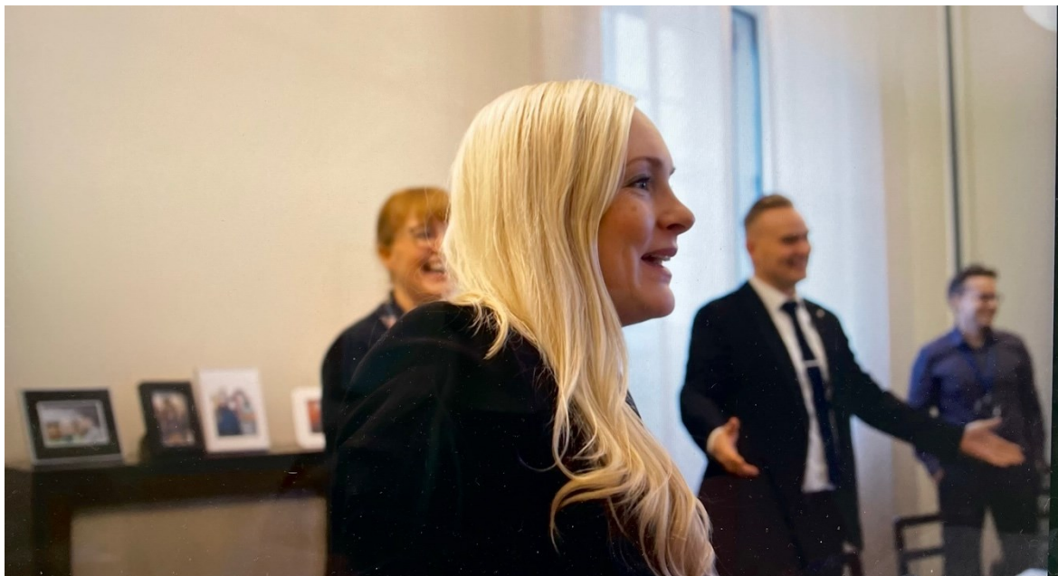
Kuva 4: Maria Ohisalo kertomassa iloisena pakolaiskiintiön nousemisesta.

Ohisalon tyytyväisyys ja ylpeys tehdystä työstä välittyy hänen kertoessa hallituksen aikaisia saavutuksia. Tämä korostuu etenkin puhuttaessa pakolaiskiintiön kasvusta. Ohisalo on kuvattu kertomassa pakolaiskiintiön kasvusta innokkaasti, ja ennen puhettaan hän kävelee apulodien saattelemana huoneen poikki kollegoidensa keskelle. Tämän voidaan nähdä olevan retorinen keino vahvistaa katsojassa mielikuvaa Maria Ohisalosta tasa-arvoa ajavana naisjohtajana. Yllä olevassa kuvassa näkyvä hymy hänen kasvoillaan kerrottaessa pakolaiskiintiöiden nousseen, vakuuttaa katsojat siitä, että tasa-arvon edistäminen todella on Ohisalolle tärkeää ja hän on vilpittömästi onnellinen saavuttaessaan tavoitteitaan kohti tasa-arvoisempaa Suomea.