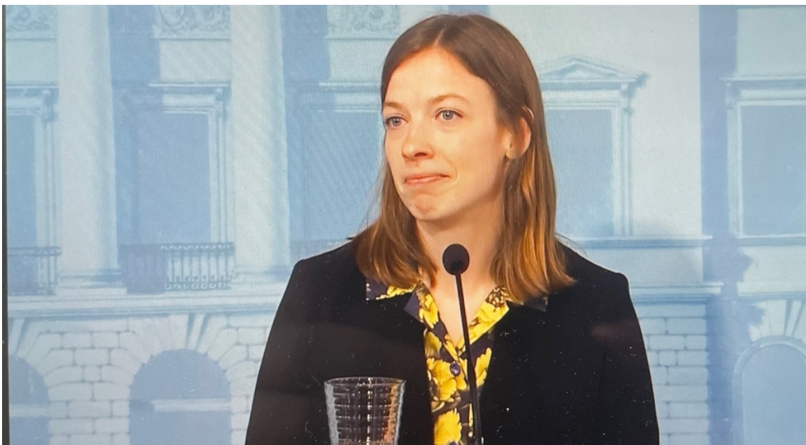
Kuva 7: Li Andersson herkistyy tiedotustilaisuudessa, jossa kerrotaan koulujen sulkemisesta.

Mitä Anderssonin herkkyyteen tulee, välittyi se erityisen selkeästi puhuttaessa lapsiin liittyvistä asioista. Herkkyyden esiin tuominen useissa sarjan jaksoissa ja kohtaauksissa on yksi selkeimmistä sarjassa ilmenneistä retorisisista keinoista muodostaa tietynlaista naisjohtajuuskuvaa. Herkkyyks ilmenee esimerkiksi koronakriisin aikaisessa tiedotustilaisuudessa, jossa Andersson kertoi peruskoulujen sulkemisesta. Hän herkistyi puheessaan. Herkistyminen luo mielikuvaa ihmisestä, joka tuntee empatiaa lapsia kohtaan ja kokee syyllisyyttä koulujen sulkemisesta tiedostaessaan, millaisia seurauksia sillä voi olla.