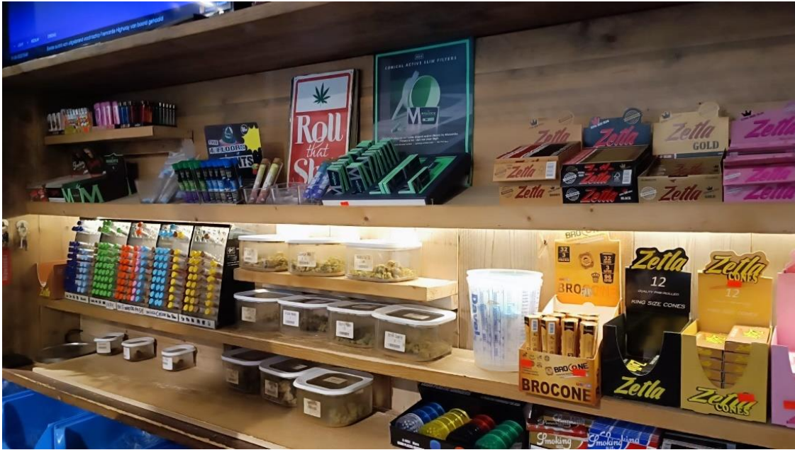
Kuva 2 Myytäviä kannabistuotteita.