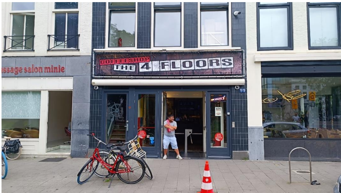
Kuva 1 Kannabiskahvila Rotterdamissa. Lähde: Veera Haerting, 2023

Alankomaissa kannabisturismi on arkinen ilmiö, ja valtio onkin yksi tunnetuimmista kannabisturismin kohteista. Kannabista myydään sitä varten erikseen tarkoitetuissa coffeeshopeissa eli kannabiskahviloissa (Kuva 1). Vaikka kannabis oli Alankomaissa laitonta 1970-luvun alussa, kauppaa kuitenkin suvaittiin. Kulttimaineen saanut Melkweg tai Milky way -klubi myi kannabista, jota ostajat saivat rauhassa nauttia saman klubin tiloissa. Useat suomalaisetkin turistit nauttivat vapaasta kannabiksesta Melkweg-klubilla. (Mikkonen, 2016, s. 152.)