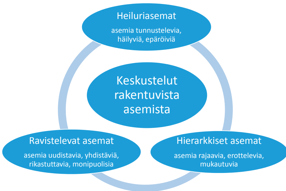
Kuvio 1. Keskusteluissa rakentuvat kokemusasiantuntijoiden työelämäasemat