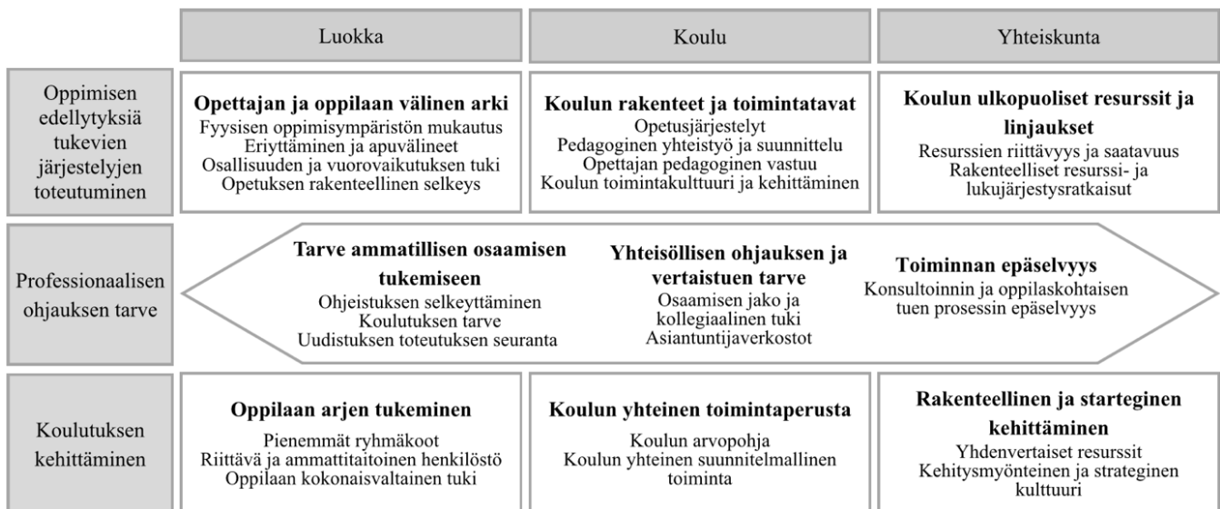
Kuvio 3. Tulosavaruus erityisopettajien käsityksistä tuen uudistuksesta