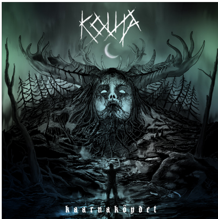
Kuva 18 – Kansi 2: Äitimaan laulu (Kinnunen, 2024).

Toinen kansikuva syntyi Äitimaan laulu -kappaleen pohjalta. Kuvituksessa käyttämäni visuaalinen näkökulma on intervisuaalisuus. Interisuaalisuus tarkoittaa sitä, millä tavoin teokset viittaavat, lainaavat, kommentoivat tai muokkaavat toisiaan visuaalisesti. Interisuaalisuus ja intertekstuaalisuus ovat verrannollisia keskenään, sillä siinä missä intertekstuaalisuus lainaa, muokkaa tai kommentoi toista tekstisisältöä, interisuaalisuus tekee sen visuaalisin keinoin, kuten kuvin.