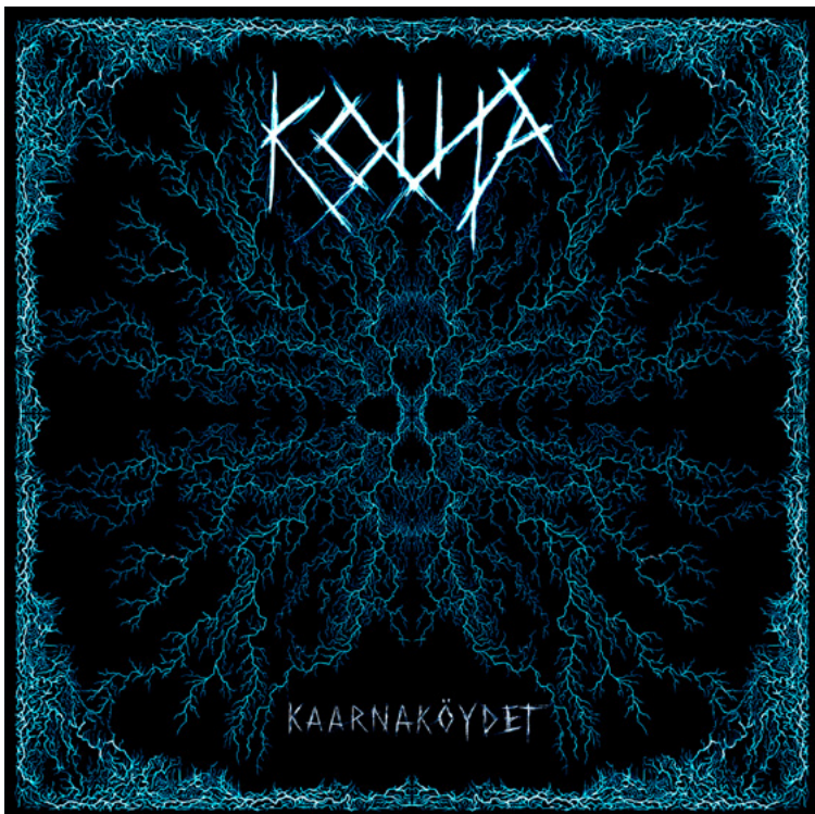
Kuva 33 – Kansi 4: Häpeä (Kinnunen, 2024)

Neljännens, ja näin myös viimeisen albumin kannen tein Häpeä -kappaleen pohjalta, hyödyntäen täysin omaa henkilökohtaista tulkintaani visuaalisena näkökulmana. Halusin lähestyä kuvitusta ilman ulkopuolisia ohjauksia tai valmiiksi annettua visuaalista viitekehystä, keskittyen pelkästään siihen, mitä sanoitukset minussa herättivät. Tavoitteenani oli rakentaa kuva, joka ei ainoastaan kuvittaisi tekstiä, vaan eläisi sen rinnalla, heijastaen sen emotionaalista painoa ja sanoitusten raakaa tunnelmaa.