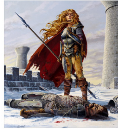
Kuva 30 – Boris Vallejo: Journey's End , 2001.