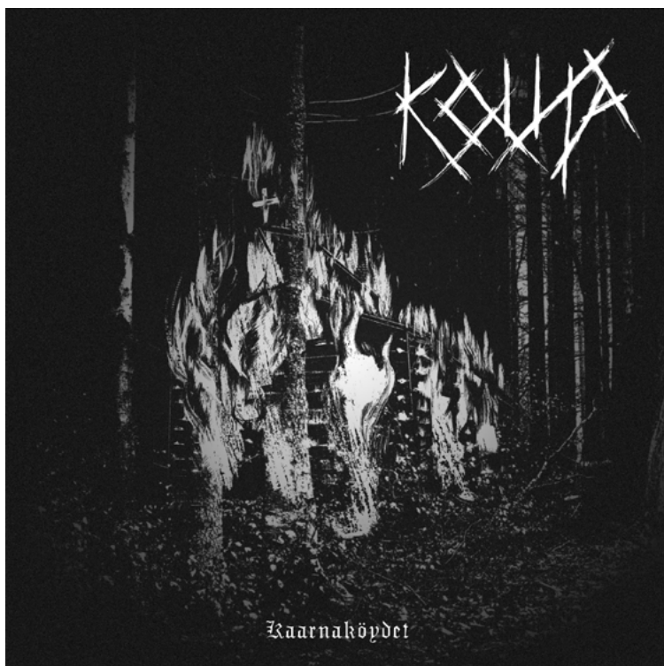
Kuva 3 – Kansi 1: Sukujyrkkämä (Kinnunen, 2024)

Ensimmäisen kansikuvan tein Sukujyrkkämä -kappaleen pohjalta, ja hyödynsin siinä perinteistä Black metal -estetiikkaa. Pohjatyönä ensimmäistä taiteellista työtä varten olin käynyt läpi Black metal -albumeiden kansia, ja lukenut niihin liittyvää kirjallisuutta. Black metal -musiikki on myös kauan kuulunut kiinnostuksen kohteisiini, joten genren konventiot ovat tulleet minulle tutuiksi. Ensimmäisen kansikuvan kohdalla halusin löytää syvempää ymmärrystä musiikkigenrestä ja osoittaa, ettei perinteisen Black metal -taiteen tarvitse olla itseään toistavaa, tai kliseistä.