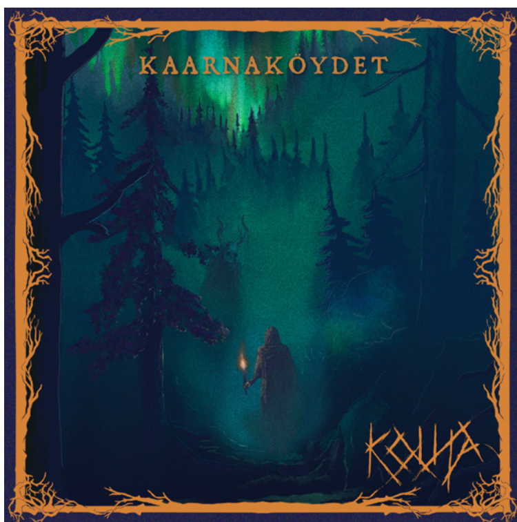
Kuva 27 – Kansi 3: Turjan takaa (Kinnunen, 2024).

Kolmas toteuttamani kansi syntyi Turjan takaa -kappaleen pohjalta. Kolmannen kansikuvan kohdalla hyödynsin retrofantasian estetiikkaa visuaalisena lähtökohtana. Retrofantasia viittaa visuaaliseen tyyliin, joka ammentaa vaikutteita 1970–80-lukujen fantasiakuvituksesta, kuten vanhoista roolipelien kansista, pulp-fantasiakirjallisuudesta ja klassisten Heavy metal -levyjen kuvituksista. Tyyli on ominaista käsin piirretyn näköinen jälki, vahva kontrasti ja sankarilliset tai myyttiset kuva-aiheet. Tekemiseni keskiössä oli halu kokeilla, kuinka tällainen selkeästi Black metal -genren konventioista poikkeava tyyli toimisi tarinallisten piirteiden ilmaisijana ja kappaleen tunnelman välittäjänä.