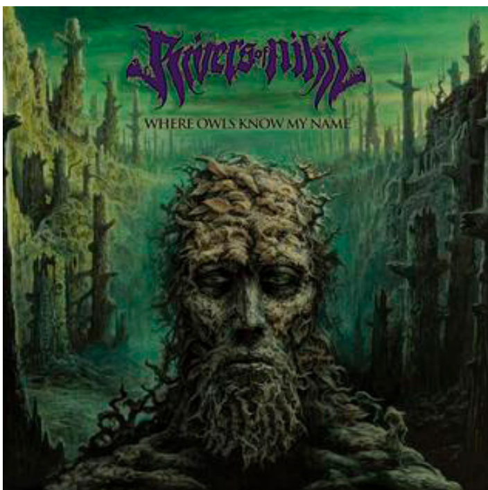
Kuva 26 – Rivers of Nihil: Where Owls Know My Name, 2018.