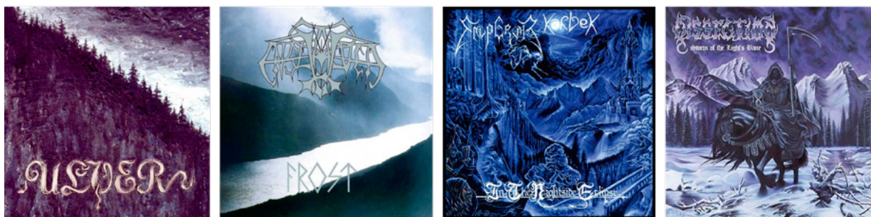
Kuva 4 – Ulver: Bergtatt, 1994. (metal-archives.com, n.d.)