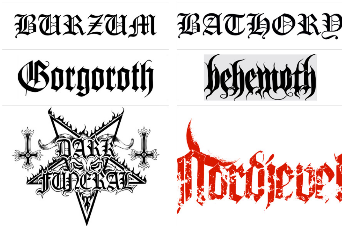
Kuva 8 – Logo: Burzum. ( logos.fandom.com/wiki/burzum , n.d.)

vaikealukuisten, käsin piirrettyjen logojen rinnalla toimivat synteesissa luoden visuaalista jännitettä. Molemmat tyyliä nojaavat samaan tehokeinoon: luettavuuden uhraamiseen tyyliin. Sen lisäksi, että blackletter kirjaimia käytetään Black metalissa vaikealukuisten logojen rinnalla, niitä myös usein yhdistellään.