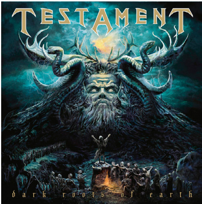
Kuva 19 – Testament: Dark Roots of Earth , 2012.