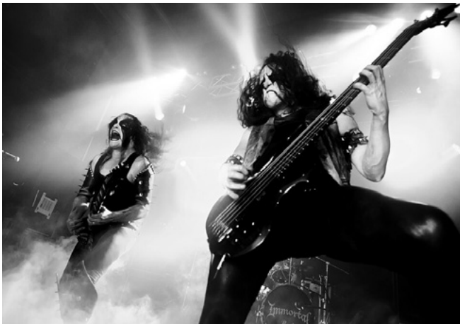
Kuva 1 – Norjalainen Black metal -yhtye Immortal esiintymässä festivaalilla Hole in the Sky Bergenissä 28. elokuuta 2011.

Toisen aallon Black metal, joka nousi erityisesti 1990-luvun alussa Norjassa, on laajasti tunnustettu ja tunnettu vaihe Black metal -musiikin historiassa, jossa genre löysi muotonsa niin musiikillisesti, visuaalisesti kuin ideologisestikin (Patterson, 2013, s. 6–8). Tämä aikakausi, jota edustavat yhtyeet kuten Mayhem, Darkthrone, Burzum, Emperor ja Immortal, loi monia niistä tunnusomaisista piirteistä, jotka nykyisin yhdistetään Black metaliin: raakaa ja kylmää äänimaailmaa, corpse paint -kasvomaalauksia, yksinkertaistettua tuotantoa, symbolisesti ladattuja logoja sekä synkkää ja usein misantroopista maailmankuvaa (Patterson, 2013, s. 212, 242, 284, 475).