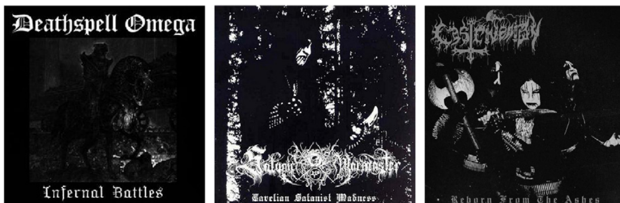
Kuva 14 – Deathspell Omega: Infernal Battles , 2000. ( metal-archives.com , n.d.)

Black metal -musiikin kansitaide jäljentelee usein mustavalko kopiokoneen jälkeä. Kuvia on muokattu manuaalisesti korkean kontrastin saavuttamiseksi, joka on luonut tietynlaisen tekstuurin kuville.