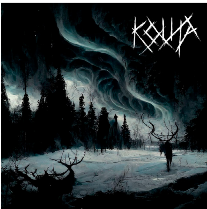
Kuva 2 – Kouta: Kaarnaköydet , 2023. ( koutaband.bandcamp.com , n.d.)

Olen tehnyt neljä vaihtoehtoista kansikuvaa Kouta-yhtyeen Kaarnaköydet -albumille. Albumin (kuva 2) alkuperäinen kansikuva on tehty tekoälyä hyödyntämällä, joka inspiroi minua tekemään vaihtoehtoisia kansikuvia, ja tarkastelemaan sitä, millä eri keinoilla ihmistaiteilija pystyy kytkemään tekemäänsä taiteeseen uusia merkityksen tasoja. En tiedä tarkalleen, mitä alkuperäisen kansikuvan tekoprosessiin on kuulunut, tai kuinka paljon tekoälyä on käytetty sen suunnittelussa. Kuvaa analysoidessa voi kuitenkin huomata yhtenäisyyksiä tavanomaisen tekoälytaiteen piirteisiin.