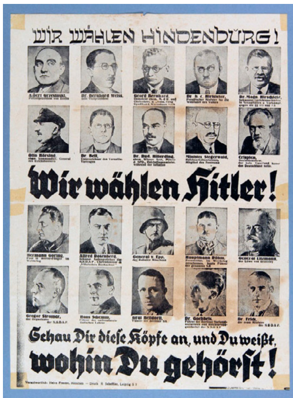
Kuva 17 – Fraktur-tyylisiä kirjaimia saksalaisessa vaalijulisteessa, 1932. ( dhm.de/lemo/kapitel/weimarer-republik/innenpolitik/praesiwahl32 , n.d.)

luettavampaa. Myös typografian symboliikkaa haluttiin muuttaa. Samoihin aikoihin sukupuolittuneet asenteet liitettiin osaksi kirjaimistoa; antiikvaa käytettiin maskuliinisuuden, vallan ja SS:n symbolina, kun taas goottilainen säilyi esimerkiksi NS Frauen-Warte –naisten lehdessä. Fraktur-tyyli nähtiin nyt feminiinisempänä, ja se miellettiin lapsuuteen liittyvänä tyylinä. (emt. s. 16–22.)