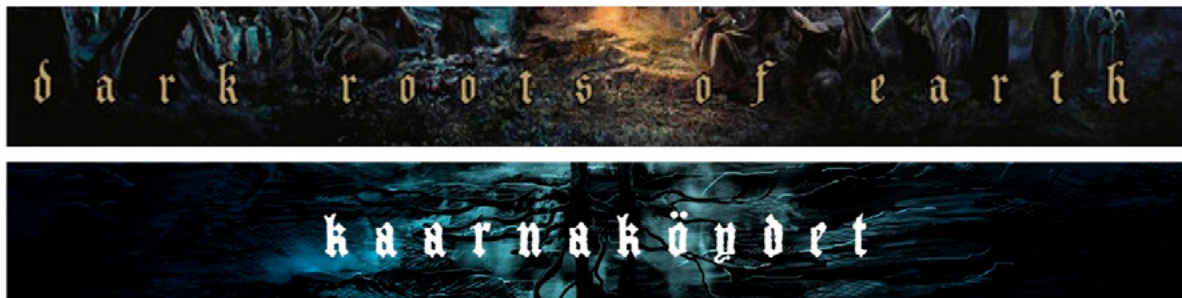
Kuva 20 – Typografian vertailu, Dark Roots of Earth ja oma Äitimaan laulu -kansi.

jonka kirjainvälistystä on kasvatettu täyttämään albuminkannen alaosaa. Kirjainten väriksi valikoitui valkoinen, sen luettavuuden parantamiseksi. Kouta-yhtyeen logo on myös valkoisella, ja se on sommiteltu kannen yläosaan keskelle.