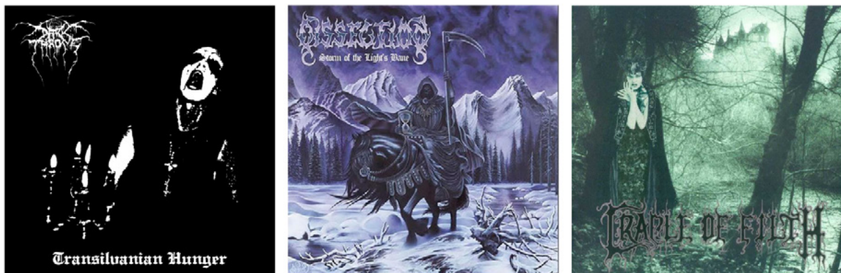
Kuva 23 – Darkthrone: Transilvanian Hunger , 1994.

Intervisuaalisuutta, ja kulttuurien välistä keskustelua on käyty Black metal -kuvastossa aiemminkin. Black metal ammentaa usein shokkiarvosta, muullakin tavalla kuin inversion ja antikristillisyyden kuvaston kautta. Tätä havainnoimaan nostan kolme Black metal -albumia: Darkthrone – Transilvanian Hunger (1994), Dissection – Storm of the Light’s Bane (1995) ja Cradle of Filth – Dusk... and Her Embrace (1996).