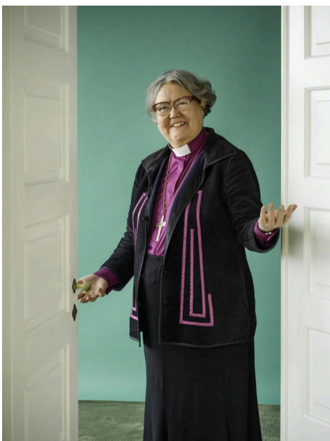
Eduskunnan puhemies, Marja Lohela 2018