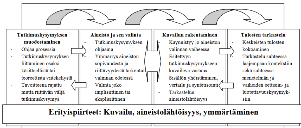
Kuvio 2 Kuvailevan kirjallisuuskatsauksen eri vaiheet (Kangasniemi ym. 2014, 294)

Salminen (2011, 6–7) kuvaa kirjallisuuskatsauksen kolme erilaista muotoa; kuvaileva kirjallisuuskatsaus, systemaattinen kirjallisuuskatsaus sekä meta-analyysi. Kuvaileva kirjallisuuskatsaus on laajasti käytössä oleva kirjallisuuskatsauksen tyyppi, ja sen avulla voidaan tutkia laajoja aineistoja, eikä siihen sisälly tarkkoja metodisia säädöksiä. Tutkimuskysymykset voivat olla kuvailevassa kirjallisuuskatsauksessa väljempinä kuin muissa kirjallisuuskatsauksen tyypeissä.