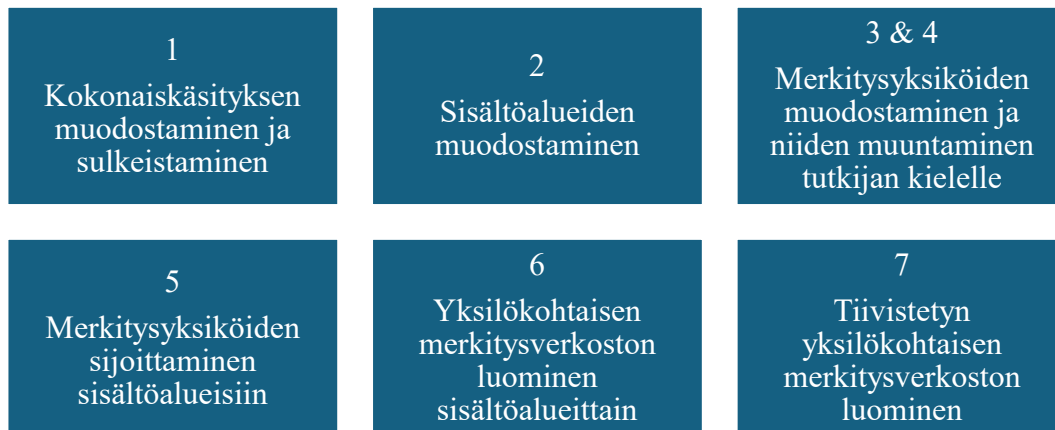
Kuvio 1. Yksilökohtaisen merkitysverkoston sovellus