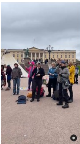
Kuva 3. Kuvakaappaus laavusta kuninkaanlinnan edessä (NSR Nuorat 2023)