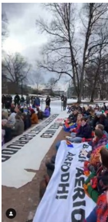
Kuva 4. Kuvakaappaus mielenosoittajista Palatsinpuistossa (NSR Nuorat)

Altan perintö kuului Fosenin puolustajien vuorovaikutuksessa kolonialismia vastustavien iskulauseiden ja luohtin eli joiun muodossa (NSR Nuorat 2023g; 2023h; 2023i; 2023j; 2023o; 2023q; 2023r; 2023s). Fosen-liikkeessä käytetty ja kuvan 4 banderollissa esiintyvä iskulause ”baajh vaeride orrudh” on eteläsaamea ja tarkoittaa ”anna tuntureiden elää” 5 , joissakin banderolleissa iskulause taipui myös muotoon ”ellos Fovsen” eli ”eläköön Fosen”. 1970–1980-luvun Alta-liikkeessä käytettiin pohjoissaamenkielistä iskulausetta ”ellos eatnu”, joka taipui norjaksi muotoon ”la elva leva” (”eläköön joki”). 6 Susanne Normann (2021, 85) huomioi kuinka iskulauseiden kierrättäminen vastarinnasta toiseen ilmentää samaa jatkuvuuden narratiivia, joka asettaa tuulivoimarakentamisen osaksi kolonialismin historiaa.