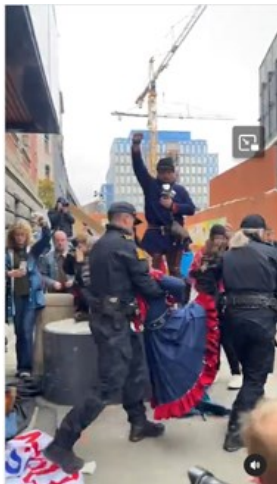
Kuva 2. Kuvakaappaus poliisista kantamassa aktivisteja (NSR Nuorat 2023)