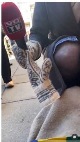
Kuva 6. Kuvakaappaus toimittajasta (NSR Nuorat 2023)

Toiminnallaan Fosenin puolustajat pyrkivät täydentämään valtamedian luomaa narratiivia sisällyttämällä oman näkökulmansa mediaesityksiin. Valtamedian luomaa representaatiota he täydentävät myös tuottamalla itse sisältöä sosiaaliseen mediaan. Fosenin puolustajien kuvaamat sisällöt tarjosivat näkökulman tapahtumien keskeltä. Kuvat 6 ja 7 ovat kuvakaappauksia sisällöistä, joissa he esittivät oman näkökulmansa median huomion kohteena olemisesta. Aineistossa toimittajat esitettiin "point of view"-sisällössä, jossa haastattelijat sekä valokuvaajat olivat kuvauksen kohteita (NSR Nuorat 2023f; 2023i). Fosenin puolustajat luovat vastanarratiivia kuvaamalla tapahtumia istumaprotestin keskeltä. Kääntämällä kuvaajan (subjektin) ja kuvauksen kohteena (objektin) olevien roolit toisin päin nuoret saamelaiset muokkaavat mielenosoittajien ja toimittajien suhteen merkityksiä.