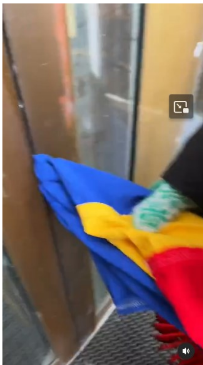
Kuva 5. Kuvakaappaus liukuovien väliin jääneestä lipusta (NSR Nuorat 2023)