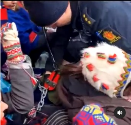
Kuva 1. Kuvakaappaus poliisista leikkaamassa kettinkejä (NSR Nuorat 2023j)