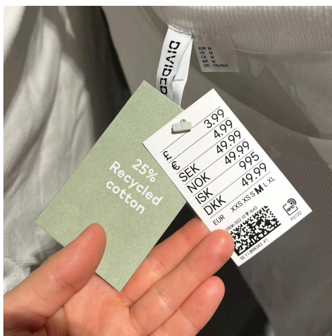
Kuva 1. T-paidan halpa hinta ihmetyttää rovaniemeläisessä vaatekaupassa.

Tarjonnan havainnoimiseksi kävin opiskelukaupunkini yhdessä suurimmista vaatekaupoista. Pikaisella selailulla löysin nopeasti useita t-paitoja hintaan 4,99 euroa. Usean hintalapun kanssa oli vihreä lappu kertomassa kierrätysmateriaaleista (kuva 1). On todettu, että vihreän värin käyttö voi lisätä ihmisten luonnonläheisyyden tunnetta, mikä puolestaan saa vaatteen tuntumaan vastuullisemmalta (Sun & Wu, 2023). Hinnasta 25,5 prosenttia on veroa, joten kaupalle jäävä osuus myynnistä on vain 3,72 euroa. Hintaan sisältyvät esimerkiksi kuidun viljelijöiden, langan ja kankaan valmistajien, suunnittelijan, ompelijöiden, yrityksen henkilöstön sekä kuljetusyritysten palkat (Suomen Tekstiili & Muoti ry, ei pvm.b). Lisäksi hintaan sisältyvät palkkauskulut, polttoainekulut, myymälän tilavuokra, hävikki, markkinointi ja muut kulut (Suomen Tekstiili & Muoti ry, ei pvm.b).