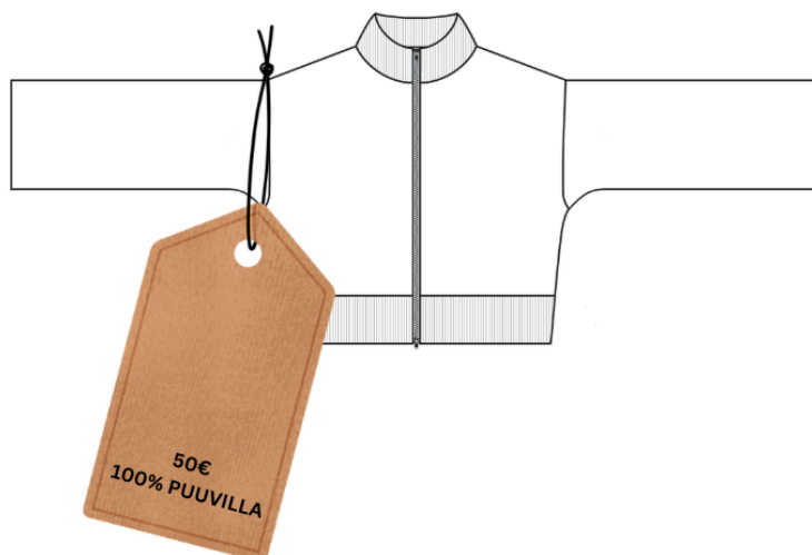
Kuva 4. Kuvituskuva: Vaate sertifiikaateilla ei yksin tee vaatteesta vastuullisempaa kuin toinen, Anne Aaltonen 2026.