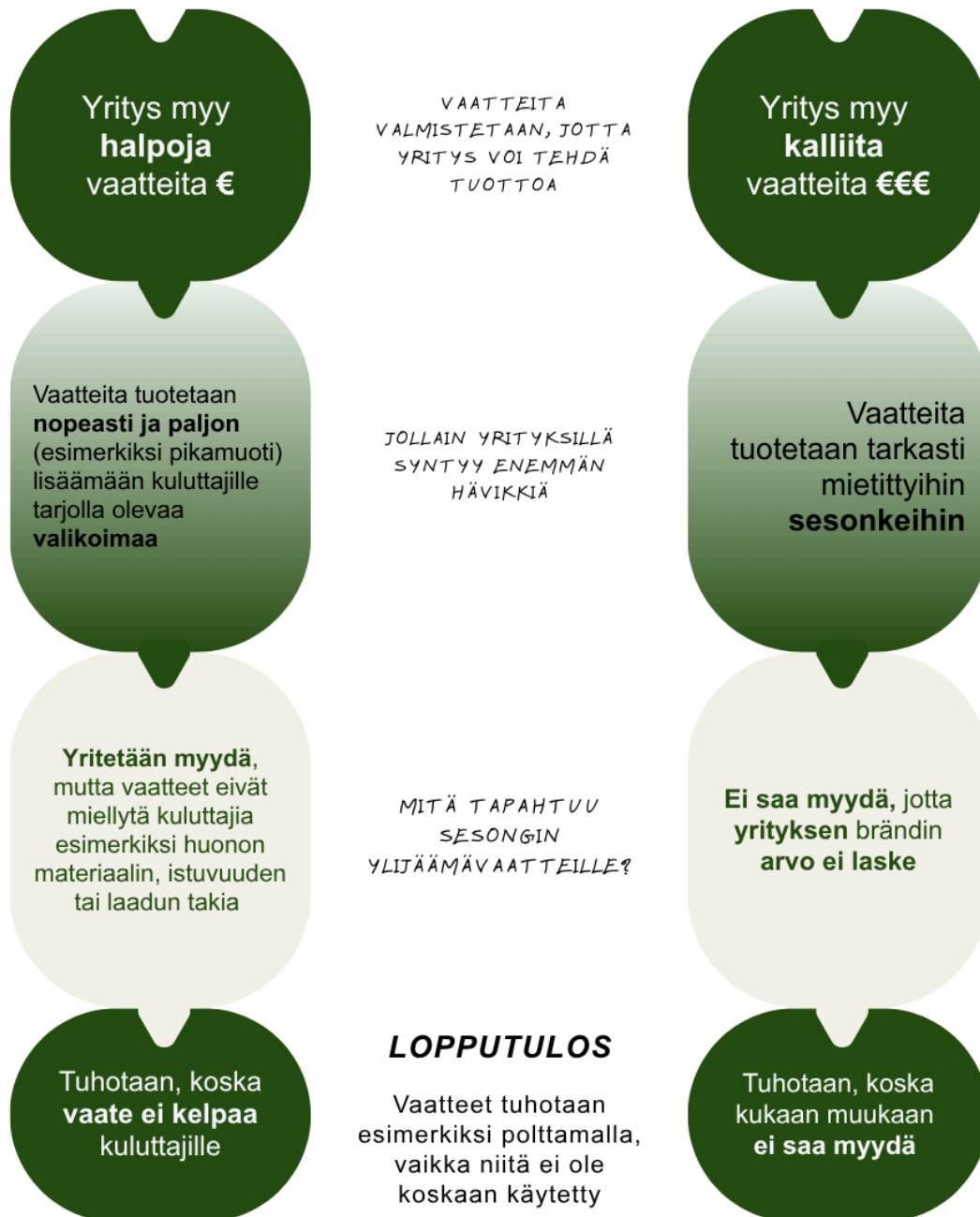
Kuva 2. Joissain tilanteissa tuotetut vaatteet eivät edes pääse ikinä käyttöön, Anne Aaltonen 2026.